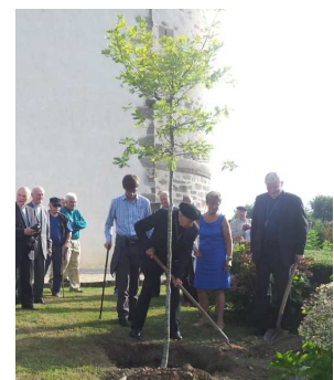
Le cardinal Etchegaray plante le chêne du futur de l'Europe le 19 août 2013